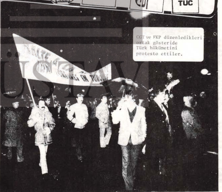
CGT ve FKP düzenledikleri ortak gösteride Türk hükümetini protesto ettiler.

●DİSK'in ilkelerini, şanlı geçmişini ve onurlu bugünü Türk-İş tabanına, en geniş işçi yığınlarına kavratmalıyız.